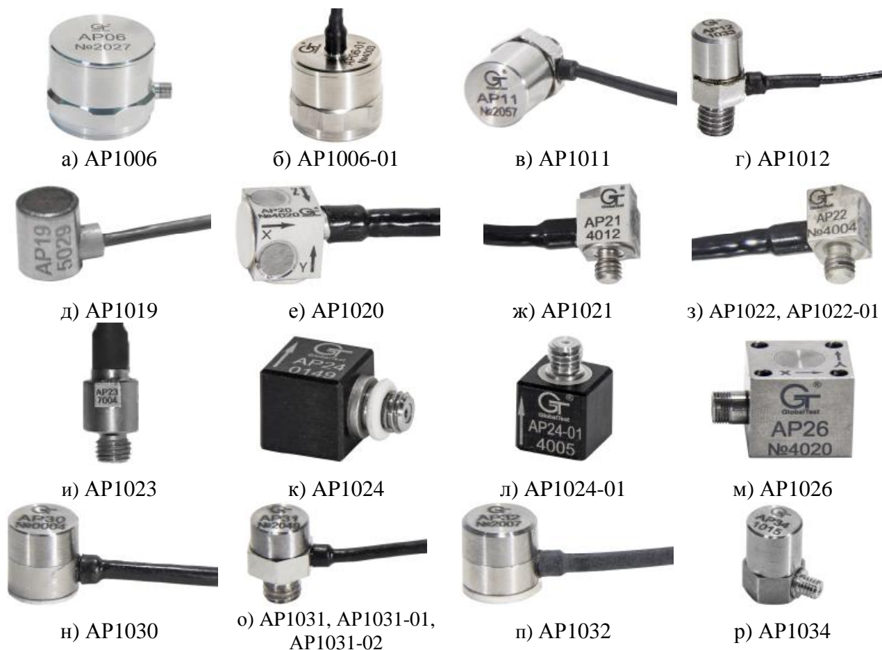
Рисунок 1 - Внешний вид датчиков серии AP10XX