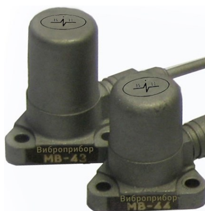
Рисунок 4 – Общий вид вибропреобразователей МВ-43 и МВ-44.