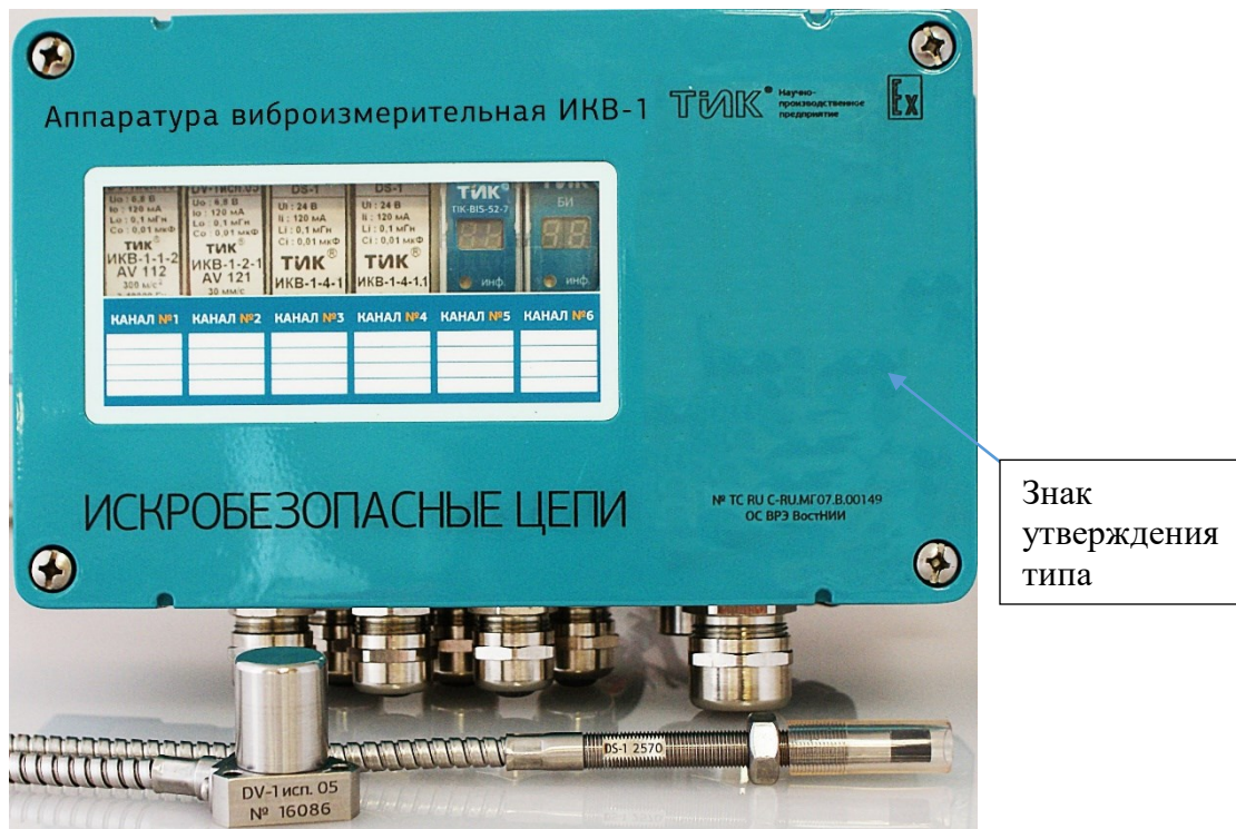
Рисунок 1 - Общий вид аппаратуры виброизмерительной ИКВ-1

Общие виды вихретоковых преобразователей DS-0, DS-1, DS-2 и DS-3, вибропреобразователя DV-1, вибропреобразователей МВ-43 и МВ-44 представлены на рисунках 2, 3 и 4.