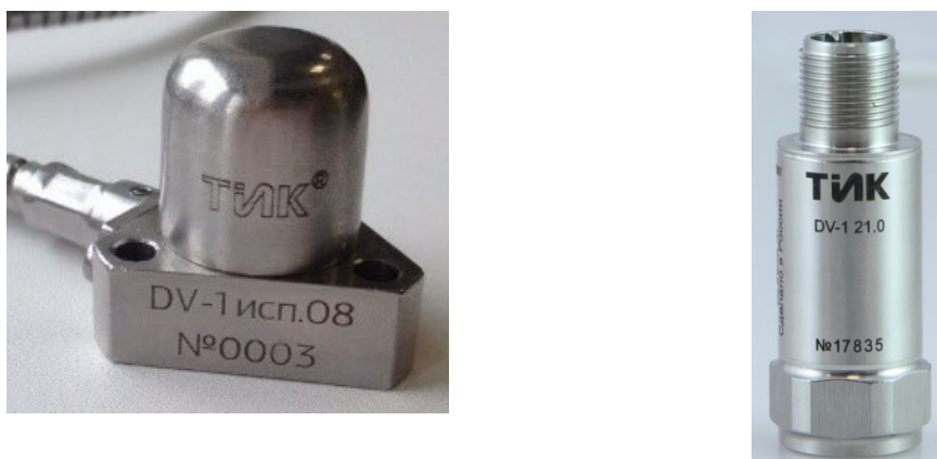
Рисунок 3 – Общий вид вибропреобразователя DV-1