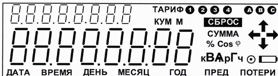
Рисунок 1 – Внешний вид ЖКИ

6.3.5 Последовательно нажимая кнопки управления счетчика (счетчики «Меркурий 204», «Mercury 204», «Меркурий 234», «Mercury 234») убедиться, что после каждого нажатия кнопки происходит изменение информации на ЖКИ.