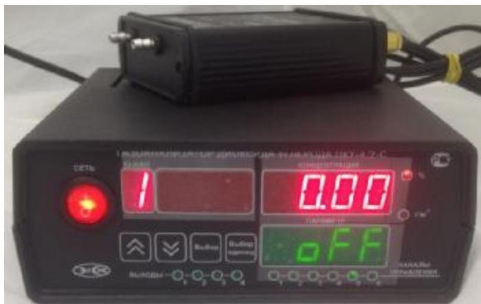
в) исполнение ПКУ-4 /2-С (двухканальный, на фото показан только один измерительный преобразователь)