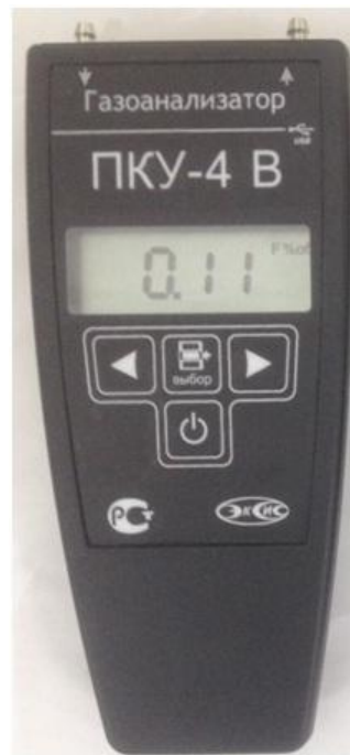
б) исполнение ПКУ-4 В-П