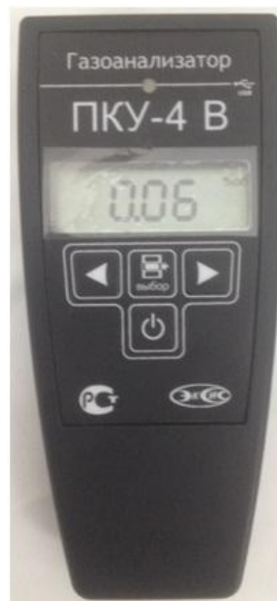
в) исполнение ПКУ-4 В-П-Д