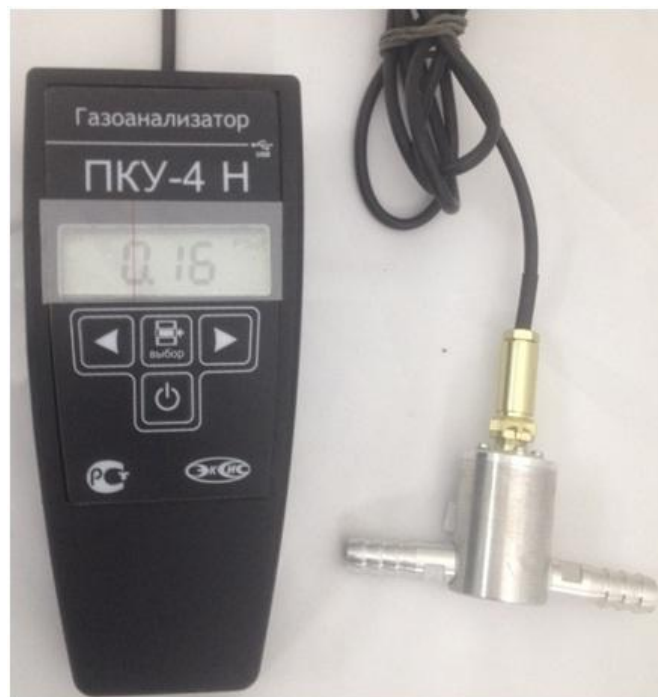
б) исполнение ПКУ-4 Н-П