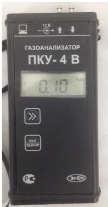
а) исполнение ПКУ-4 В-М

Внешний вид газоанализаторов приведен на рисунках 1 – 3. Место и способ опломбирования выносного измерительного преобразователя газоанализатора приведено на рисунке 4.