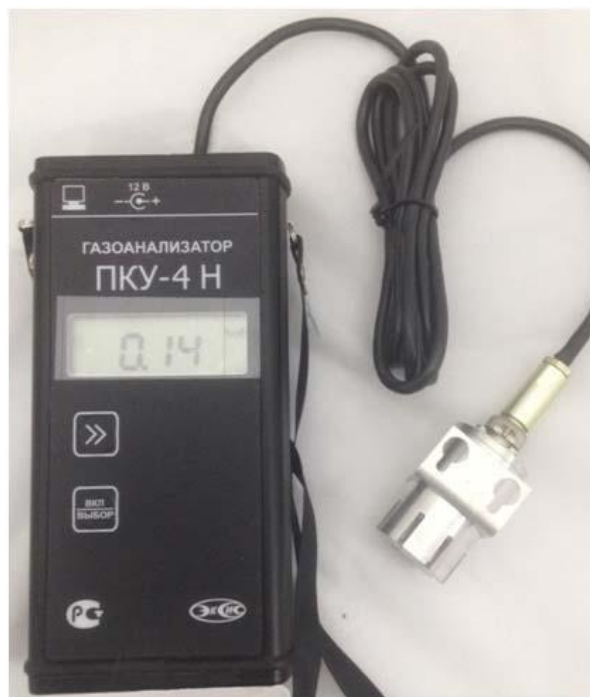
а) исполнение ПКУ-4 Н-М