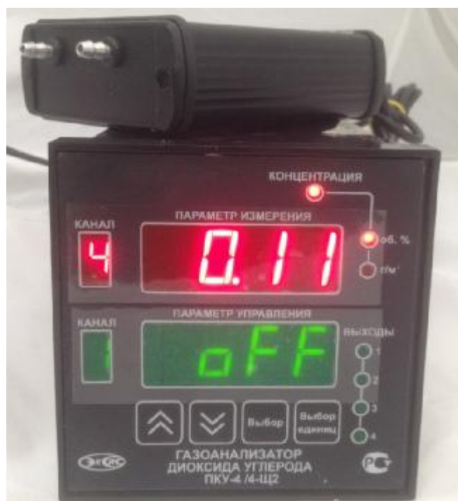
б) исполнение ПКУ-4 /4-Щ2 (четырёхканальный, на фото показан только один измерительный преобразователь)