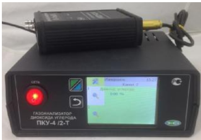
г) исполнение ПКУ-4 /2-Т (двухканальный, на фото показан только один измерительный преобразователь)