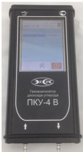
в) исполнение ПКУ-4 В-М-Т