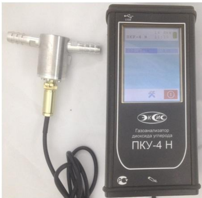
в) исполнение ПКУ-4 Н-М-Т