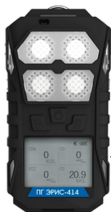
Рисунок 4- Общий вид газоанализатора ПГ ЭРИС-414-1 и схема пломбировки