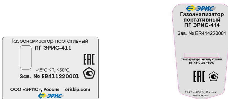
Рисунок 1 - Маркировочные таблички газоанализаторов ПГ ЭРИС-411, ПГ ЭРИС-414 с указанием заводского номера и знака утверждения типа

Для защиты от несанкционированного доступа в газоанализаторах предусмотрена установка разрушаемой пломбы-наклейки изготовителя. Общий вид газоанализаторов с указанием мест пломбирования представлен на рисунках 2-5.