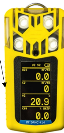
Рисунок 5 - Общий вид газоанализатора ПГ ЭРИС-414-2 и схема пломбировки