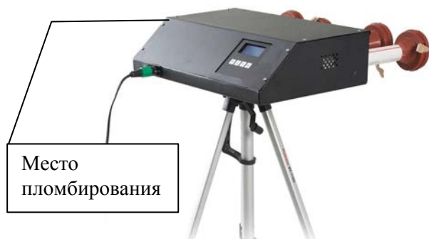
Рисунок 3 – Фотография общего вида с указанием места пломбирования приборов исполнения ПА-300М-1-2