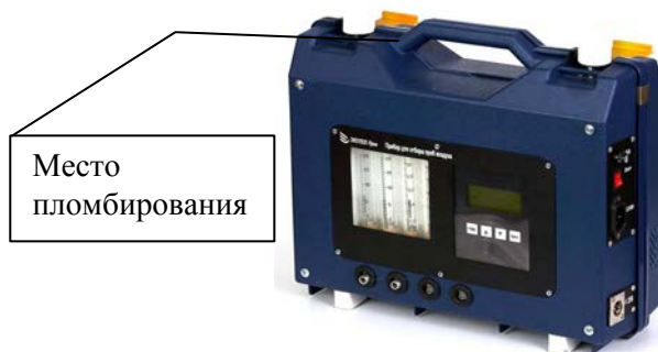
Рисунок 4 – Фотография общего вида с указанием места пломбирования приборов исполнения ПА-300М-2