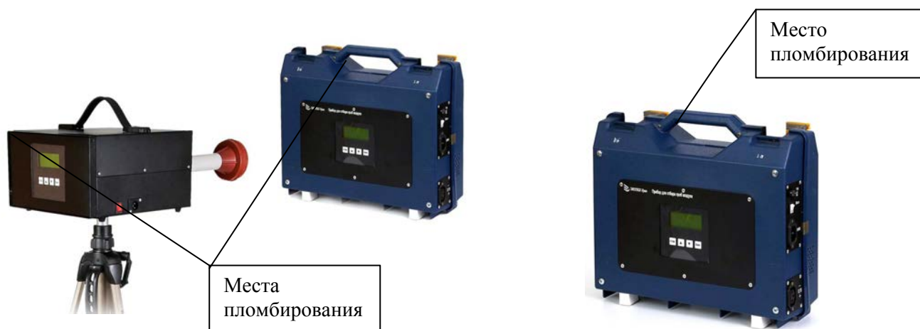
Рисунок 1 – Фотография общего вида с указанием места пломбирования приборов исполнения ПА-300М-1

Приборы ПА-300М-1 выпускаются в металлическом и пластиковом корпусах. Общий вид приборов представлен на рисунках 1, 2, 3, 4 и 5.