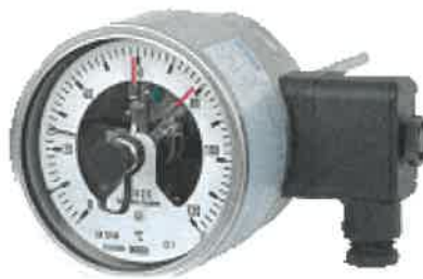
A5525, A5500, A5501, TG55