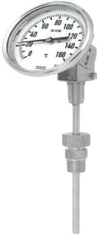
S5410, S5411, S5412, S5413