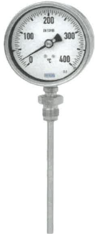
R5526, R5502, R5503, TG55