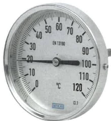
A52.025, A52.033, A52.040, A52.050, A52.063, A52.080, A52.100, A52.160