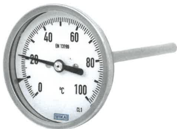
A5400, A5401, A5402, A5403