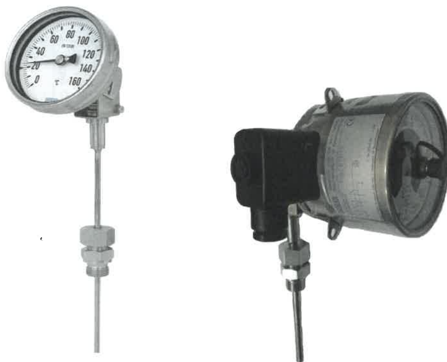
S5500, S5551, TG55