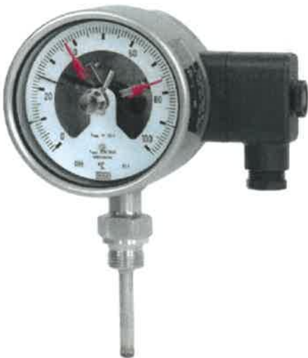
R5526, R5502, R5503, TG55