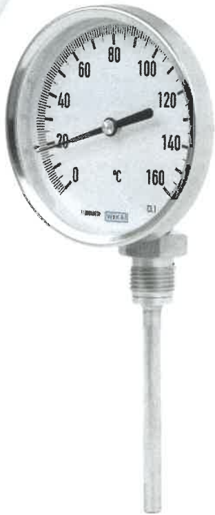
R5440, R5441, R5442, R5443