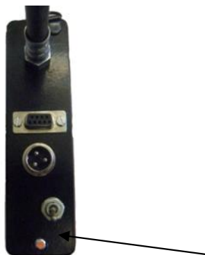
Место нанесения оттиска поверительного клейма на внешнем индикаторе для варианта исполнения «Д»