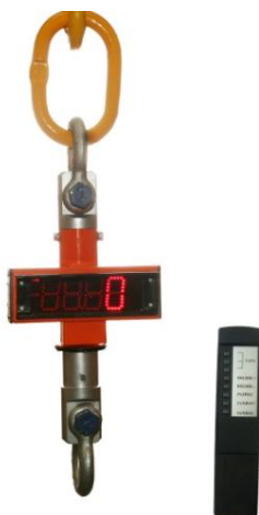
Весы МК-ХС с пультом дистанционного управления.