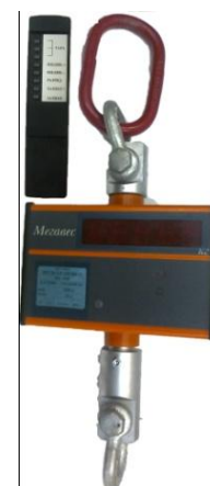
Весы МК-ХЛ с пультом дистанционного управления.