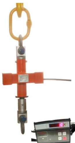
Весы МК-ХД с внешним индикатором