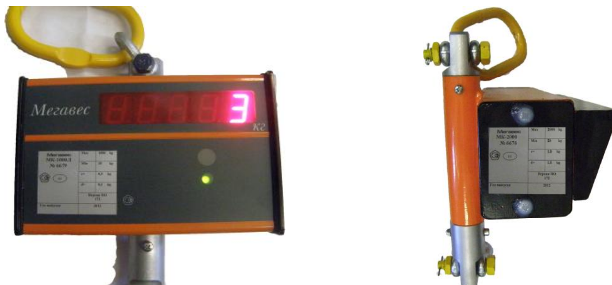
Маркировка весов электронных крановых МК-ХЛ Маркировка весов электронных МК-ХС Рисунок 2 Маркировка весов электронных крановых МК