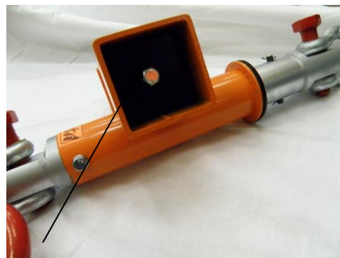
Место нанесения оттиска поверительного клейма для варианта исполнения «Д»