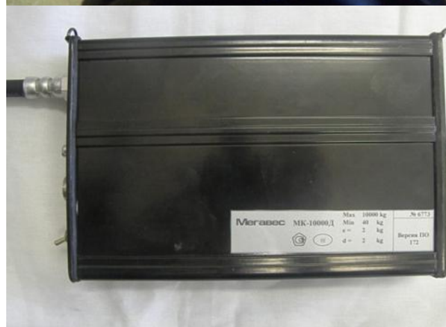
Маркировка весов электронных крановых МК-ХД