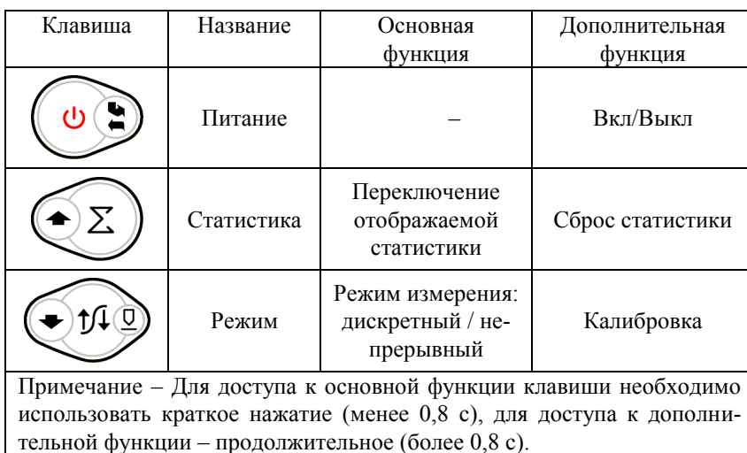
Таблица 2 – Функции клавиш толщиномера в режиме измерения