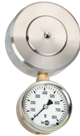
Гидравлический преобразователь силы сжатия, модель F1115