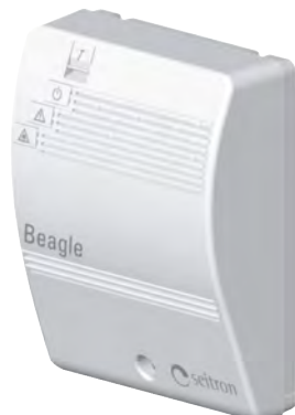
Рис. 1 Внешний вид

Официальный дистрибьютер "Seitron" s.p.a. в России МО, г. Химки, квартал Кирилловка, СНТ "Кирилловка", ул. 1-я Садовая, д. 130 тел.: (495) 795-2-795 http://www.seitron.ru