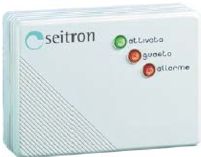
Рис1. Внешний вид