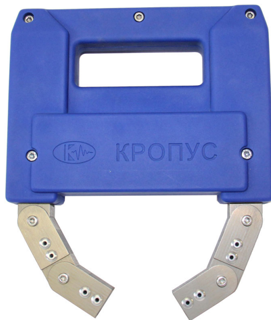
Рис.1 Намагничивающее устройство шарнирного типа КУ-140

На каркасе электромагнита установлены 2 кнопки – «Намагничивание» и «Размагничивание».