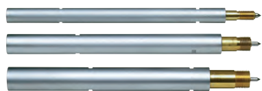
Удлинитель для измерения глубоких отверстий (опционально)