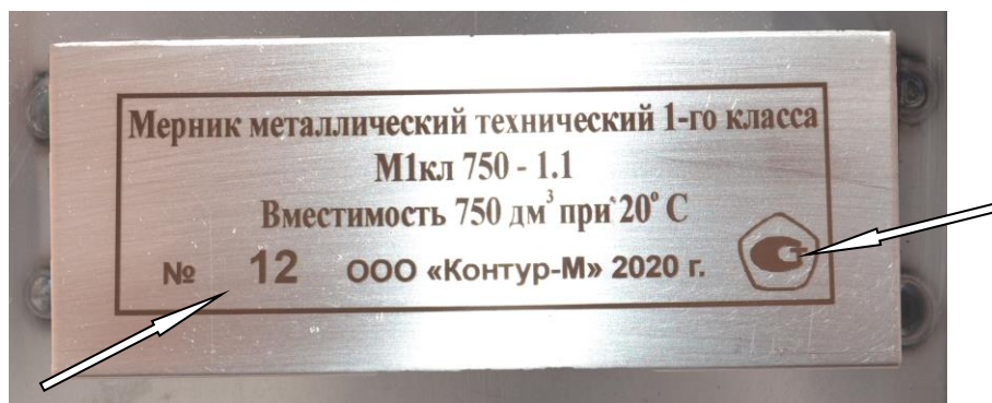
Рисунок 3 – Обозначения мест нанесения знака утверждения типа и заводского номера

Заводской номер и знак утверждения типа мерников наносятся на маркировочную табличку, закрепленную на корпусе мерника, методом лазерной гравировки. Обозначения мест нанесения знака утверждения типа и заводского номера представлены на рисунке 3.