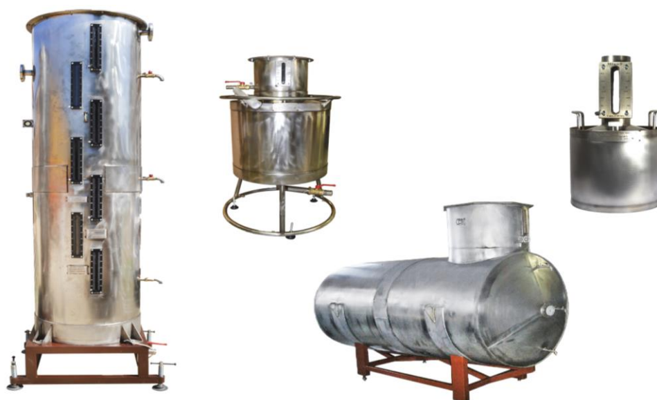
Рисунок 1 – Общий вид мерников

Общий вид мерников представлен на рисунке 1.