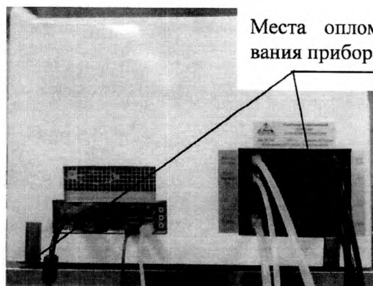
Рисунок 2 – Схема пломбировки от несанкционированного доступа спектрометра эмиссионного «СПАС-05»