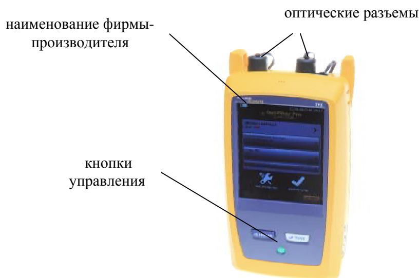
Рисунок 1 – Общий вид рефлектометра оптического OptiFiber Pro