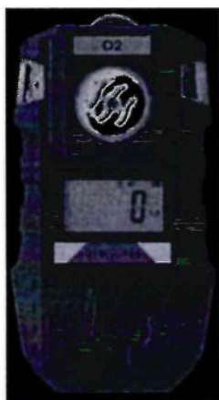
Рисунок 1 – Общий вид газоанализатора ПГ ЭРИС-411-1 и схема пломбировки от несанкционированного доступа