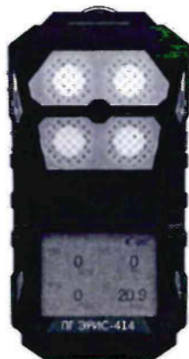
Рисунок 3 – Общий вид газоанализатора ПГ ЭРИС-414-1 и схема пломбировки от несанкционированного доступа