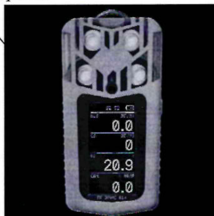
Рисунок 4 – Общий вид газоанализатора ПГ ЭРИС-414-2 и схема пломбировки от несанкционированного доступа