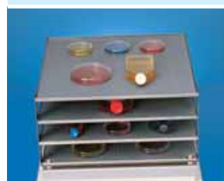
№ для заказа 3968

из высококачественной нержавеющей стали, размером 450 x 450 мм, с отверстиями для крепления зажимов для конических колб и других дополнительных принадлежностей