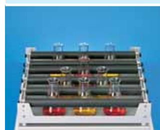
№ для заказа 3967

Противоскользящее покрытие используется для медленного перемешивания на платформе размером 420 x 420 мм, например, питательных сред в чашках Петри