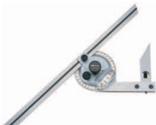
187-901 с увеличительным стеклом