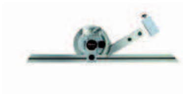
187-908 с держателем для штангенрейсмаса