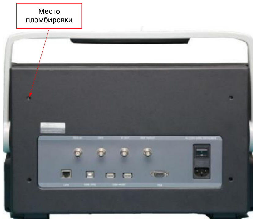
б) Вид сзади