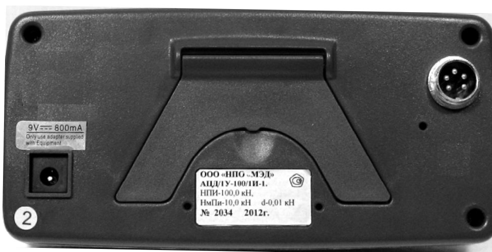
↑ Рисунок 3. Схема пломбировки от несанкционированного доступа и обозначение места (2) для нанесения оттиска клейма.