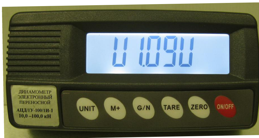
Рисунок 1. Внешний вид электронного блока с изображением версии программного обеспечения.

Т – вариант исполнения упругого элемента (1; 2; 3; 4; 5; 6; 7 приведен на рисунке 2).