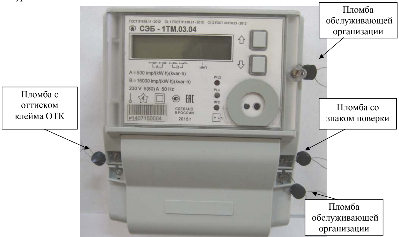
Рисунок 1 – Внешний вид счетчиков, предназначенных для установки внутри помещения, и схема пломбирования

В счетчиках установлен датчик магнитного поля, фиксирующий воздействие на счетчик магнитного поля повышенной индукции ( 2 \pm 0,7 ) мТл (напряженность (1600 \pm 600) А/м) и выше. Факт и время воздействия на счетчик повышенной магнитной индукции фиксируется в журнале событий.