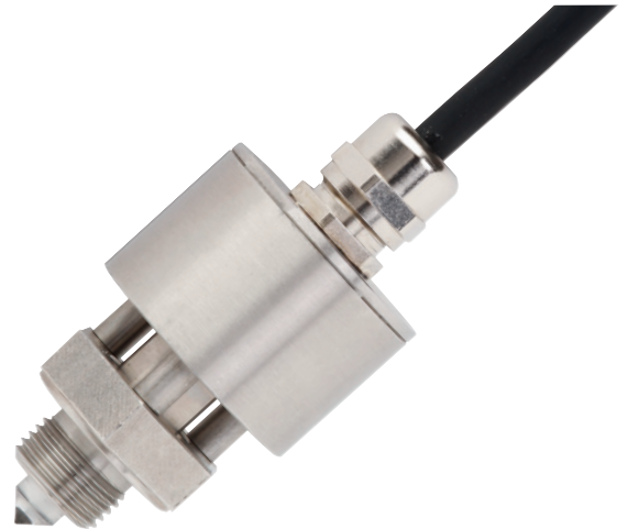
Оптоэлектронный предельный выключатель, модель OLS-5200