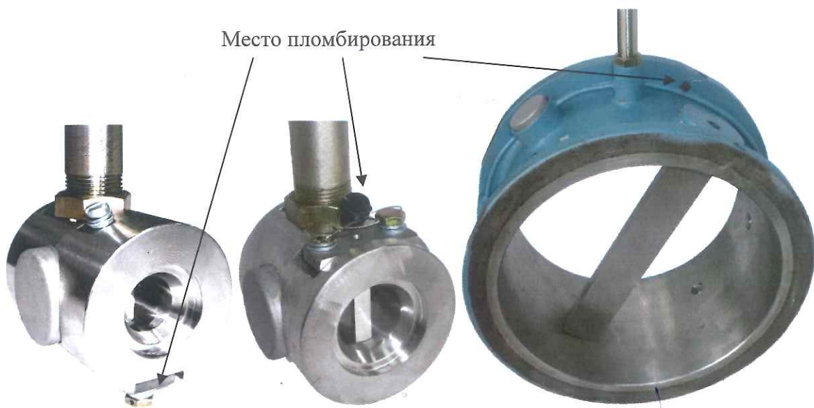
Рисунок 1 – Общий вид преобразователя с местами пломбирования