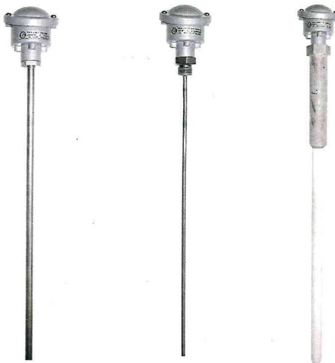
Рисунок 1 - Внешний вид

Пломбирование термопреобразователей не предусмотрено.