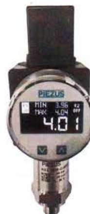
Рисунок 4 - Общий вид датчиков давления тензорезистивных ASZ