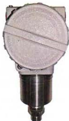
Рисунок 3 - Общий вид датчиков давления тензорезистивных AMZ