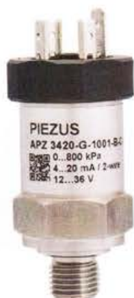
Рисунок 1 - Общий вид датчиков давления тензорезистивных APZ