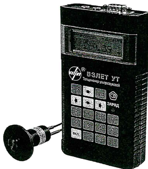
Рисунок 1 - Общий вид толщиномеров ультразвуковых «ВЗЛЕТ УТ»