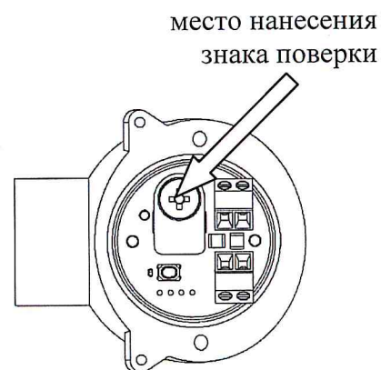
в) преобразователь температуры