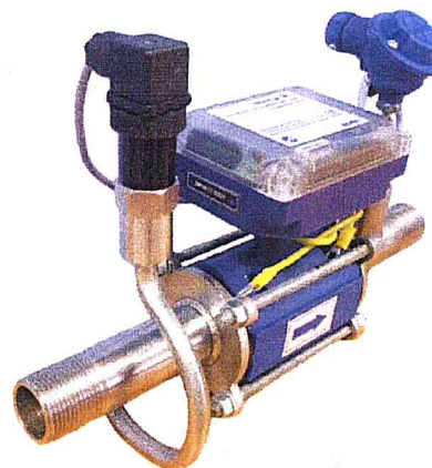
б) вид точки измерения