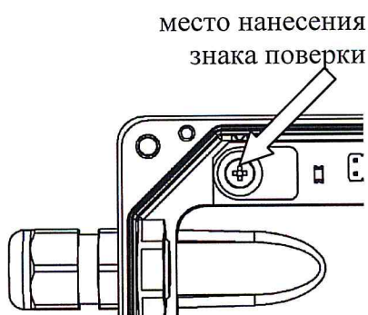
б) преобразователь расхода