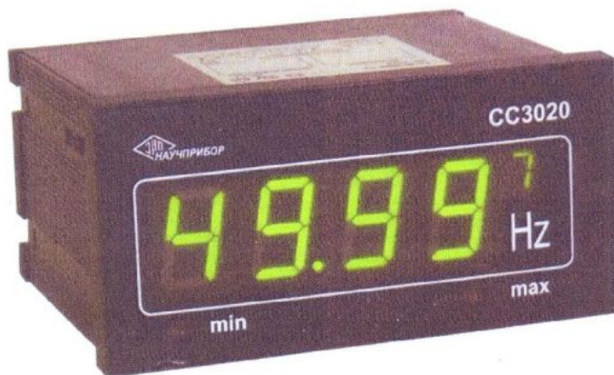
Рисунок 1. Общий вид частотомера СС3020-Щ