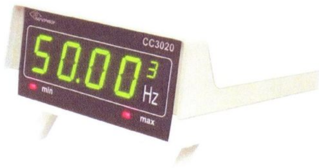
Рисунок 2. Общий вид частотомера СС3020-Н