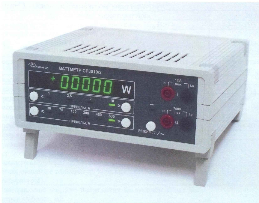
Рисунок 1. Общий вид ваттметра CP3010