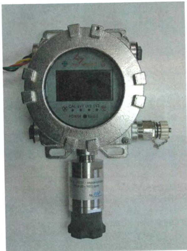
а) Газоанализатор Vector с одним преобразователем газовым

Общий вид газоанализаторов приведен на рисунке 1. Схема пломбирования газоанализаторов от несанкционированного доступа приведена на рисунке 2.