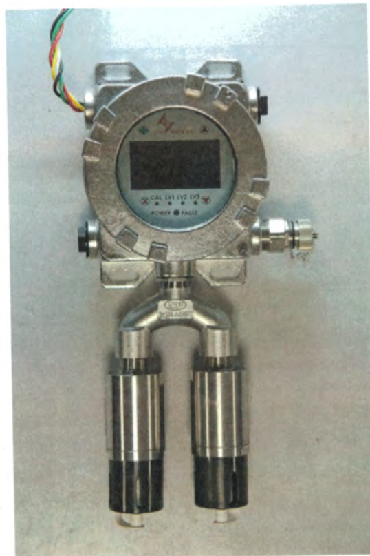
б) Газоанализатор Vector с двумя преобразователями газовыми