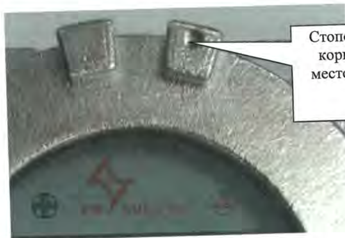
Рисунок 2 - Схема пломбировки газоанализаторов от несанкционированного доступа