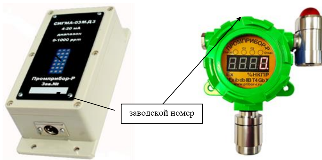
д) датчик СИГМА-03М.Д3