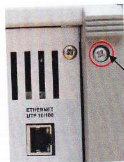
Рисунок 2 - Место на задней панели для пломбирования