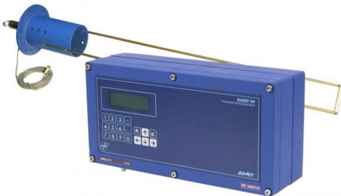
Рисунок 1 - Общий вид уровнемеров ультразвуковых «ВЗЛЕТ УР»

Общий вид уровнемеров приведен на рисунке 1.