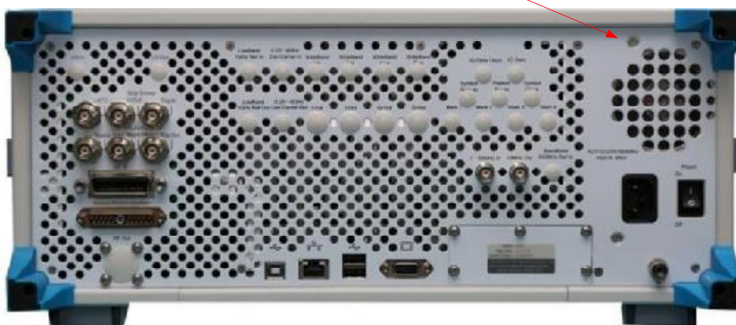
б) Вид сзади