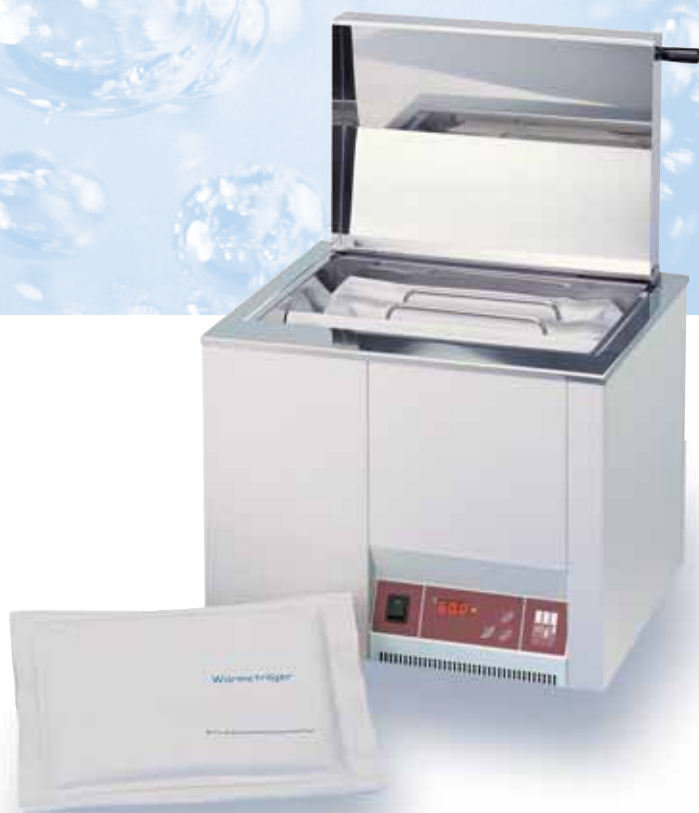
1005 водяная баня, 40 литров