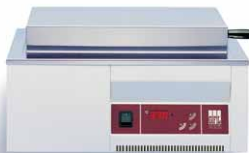
1003 водяная баня, 14 литров