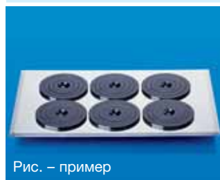
Рис. – пример

№ для заказа 1912 6 бутылок в упаковке/объем. 6 x 200 мл