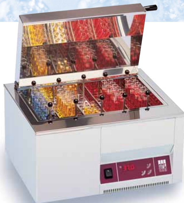
1013 водяная баня с системой циркуляции, 14 литров

Регулировка температуры: С помощью микропроцессора Постоянство температуры: \pm 0,1 °С по времени при 50 °С Диапазон температур: от значения прим. на 5 °С выше комнатной температуры до +99,9 °С с регулятором уровня 1919: начиная с температуры примерно на 3 °С выше температуры водопроводной воды до +99,9 °С Защита от перегрева: электронная при превышении заданной температуры на 4 °С и электромеханическая, если >130 °С