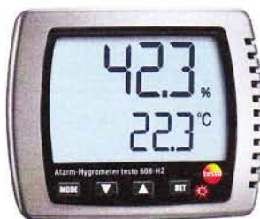
Рис. 2. Прибор комбинированный Testo 608-H2