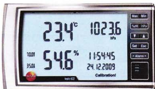
Рис. 4. Прибор Комбинированный Testo 622