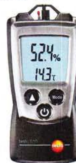
Рис. 3. Прибор комбинированный Testo 610