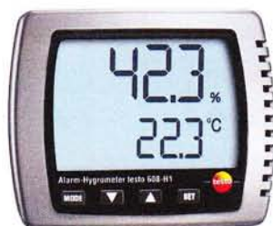
Рис. 1. Прибор комбинированный Testo 608-H1

Внешний вид приборов комбинированных показан на рисунках 1-5