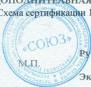
Схема сертификации 1с.