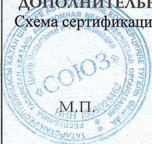
Схема сертификации 1с.