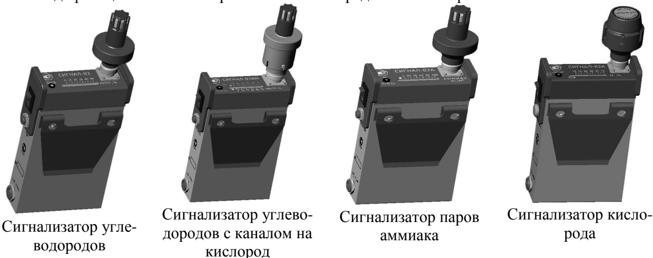
Рис.1. Модификации сигнализаторов "Сигнал-02".

Модификации сигнализаторов "Сигнал-02" представлены на рис.1.