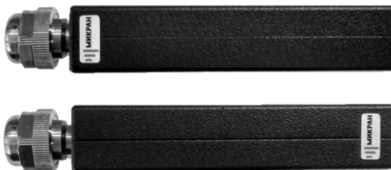
Рисунок 3 – Места пломбировки от несанкционированного доступа