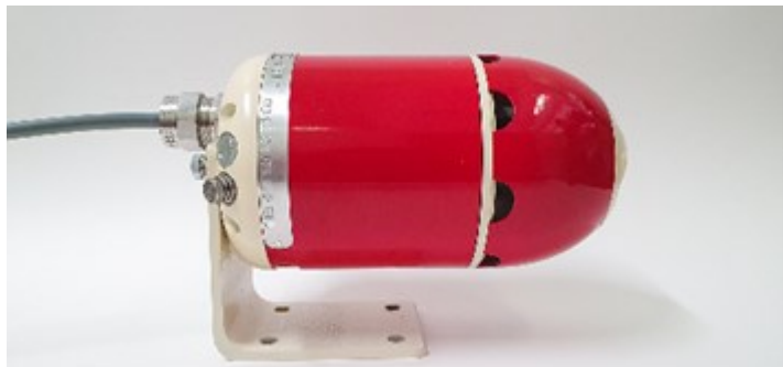
Рисунок 1 – Общий вид газоанализаторов «АЛМАЗ-СПЕКТР» с кронштейном

Нанесения знака поверки на газоанализатор не предусмотрено. Знак поверки наносится на свидетельство о поверке в соответствии с действующим законодательством.