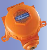
Стандартизированные газовые детекторы

Реле низкого и высокого уровня для каждого канала, а также сигналы общей тревоги и неисправности