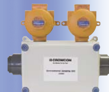
Управление системой пробоотбора