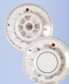
До 20 пожарных тепловых детекторов в 1 зоне