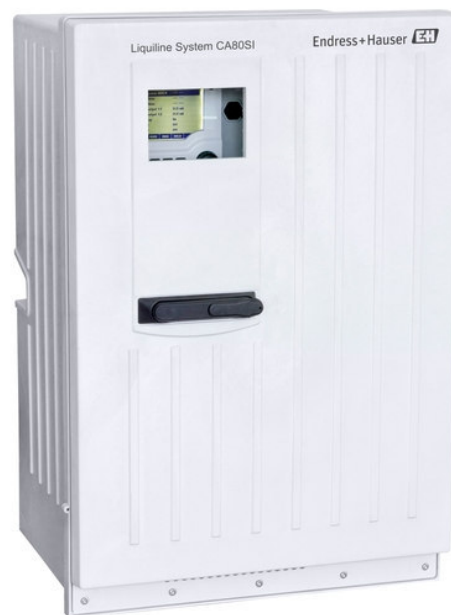
б) Liquiline System CA80SI