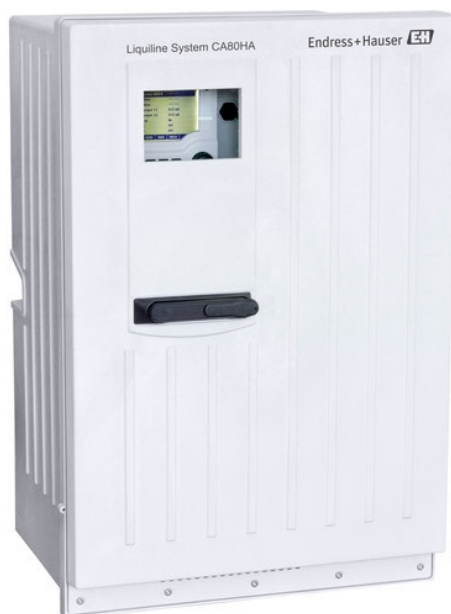
а) Liquiline System CA80HA

Пломбирование анализаторов жидкости промышленных Liquiline System CA80SI и Liquiline System CA80HA не предусмотрено.