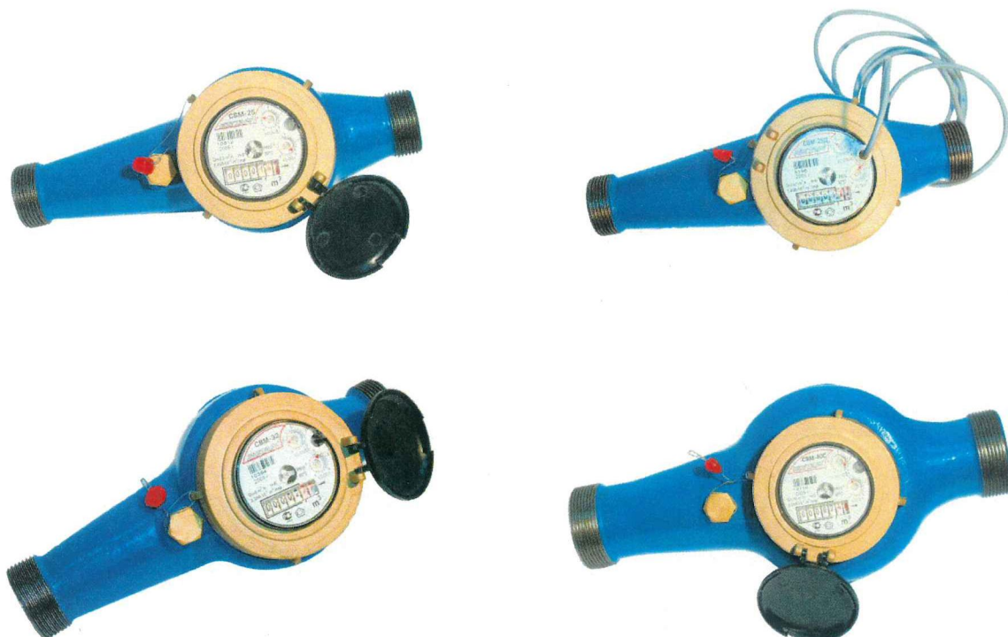
Рисунок 1 - Общий вид счетчиков СВМ