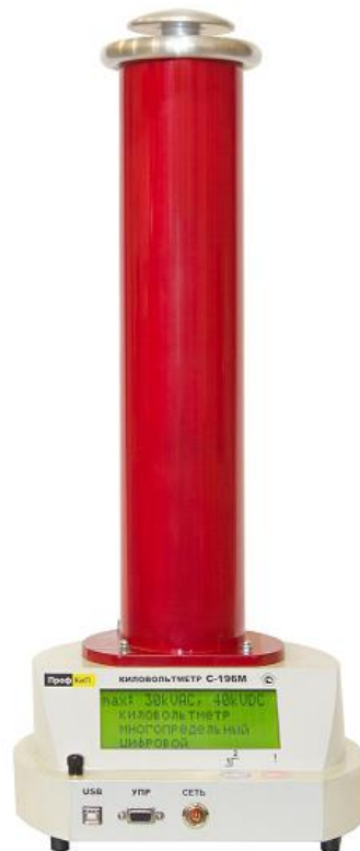
Рис 1. Внешний вид киловольтметра «ПрофКиП С196М».

Внешний вид киловольтметра приведен на рис. 1.