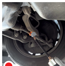
Раскрепление продольной рулевой тяги