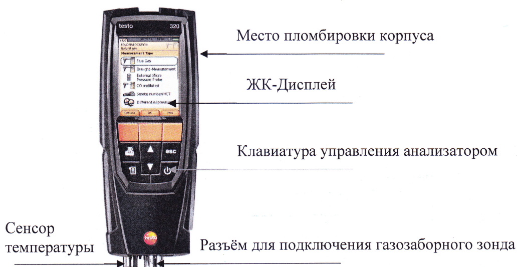
Рисунок 1 - Общий вид средства измерений

Общий вид средства измерений представлен на рисунке 1.